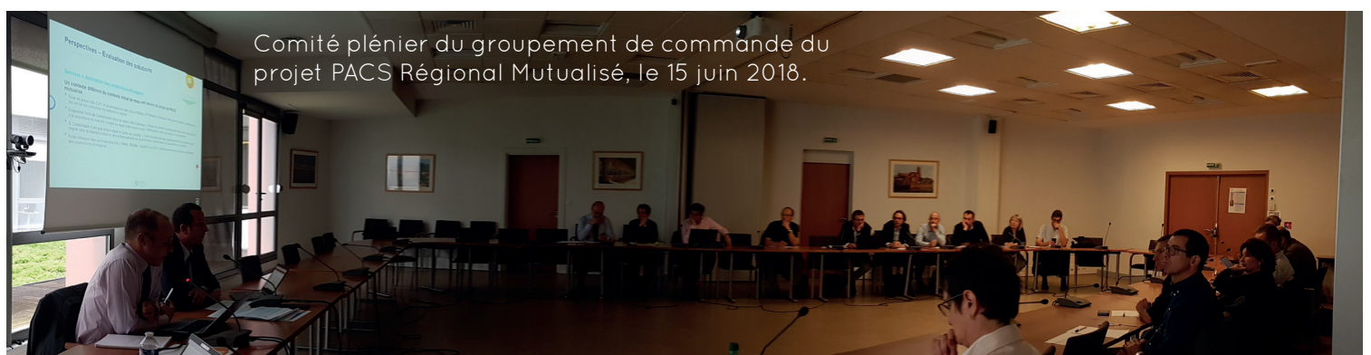
Comité plénier du groupement de commande du projet PACS Régional Mutualisé, le 15 juin 2018.

L'équipe a également annoncé pour début juillet la généralisation du service de diffusion des examens d'imagerie pour les établissements souscripteurs au service PACS et durant l'été mise en service d'un préfigurateur de partage d'antériorités entre l'IUC Toulouse et la clinique Médipôle Garonne.