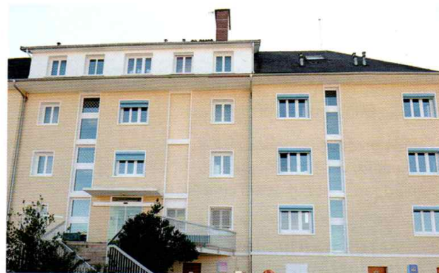
La Clinique Val de Seille à Louhans sur le site de l'Hôpital Privé Sainte-Marie